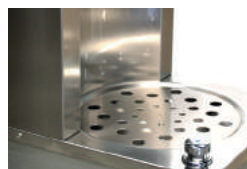
Grille inox pour carafes en option

Removable stainless steel water outlet with sanitary protection