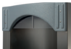
Sortie d'eau inox amovible avec protection sanitaire

Removable stainless steel water outlet with sanitary protection