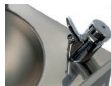
Robinet rince-bouche en option

Stainless steel grid for water jugs in option